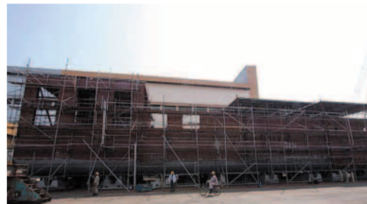
El caparazón. En los astilleros malasios de Lumut ya es visible el casco aún sin acabar del futuro barco hotel

Al concluir el interiorismo llegará la hora de navegar hasta su destino. La falta de potencia obligará a hacer trayectos cortos y se calcula que, según las condiciones del mar, el viaje se prolongará de un mes y medio a tres.●