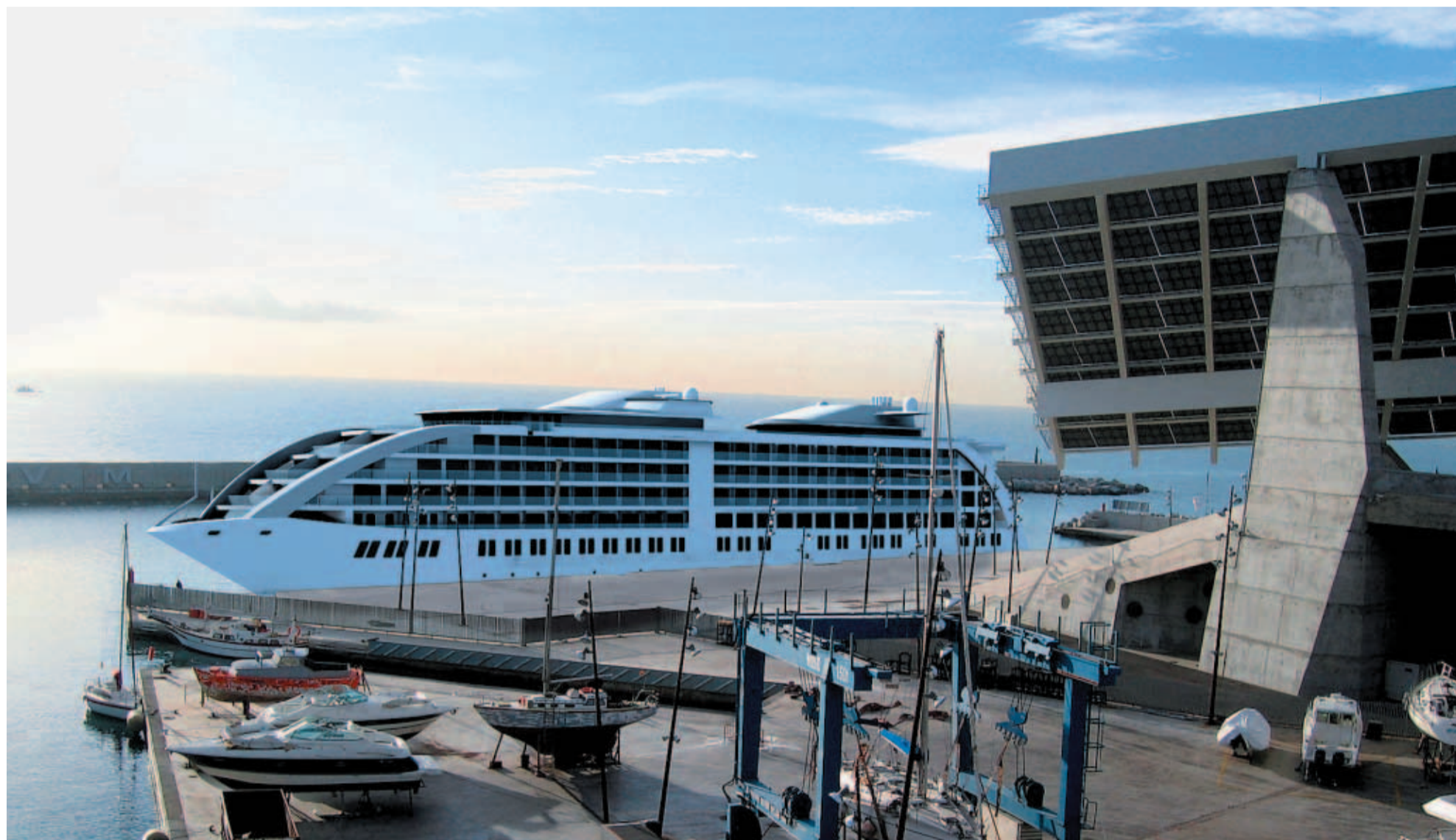
La imagen del 'Sunborn BCN'. La imagen del barco hotel, de nombre Sunborn BCN , es virtual, pero su aproximación a la realidad resulta de gran precisión