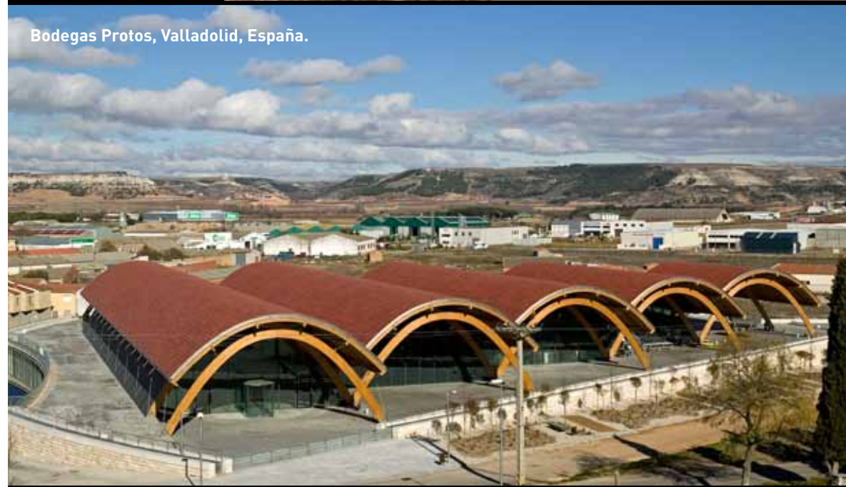
Bodegas Protos, Valladolid, España.

máximo número de días al año. Esa es, para nosotros, la auténtica y máxima sostenibilidad. Y el tiempo nos ha dado la razón, pues los estudios económicos fijaban una cifra de visitantes el primer año de 5 millones, y se han superado los... 11 millones, en tal periodo! Y la Arquitectura, tiene mucho que ver (también, por supuesto, la ubicación, la buena gestión,.....)"