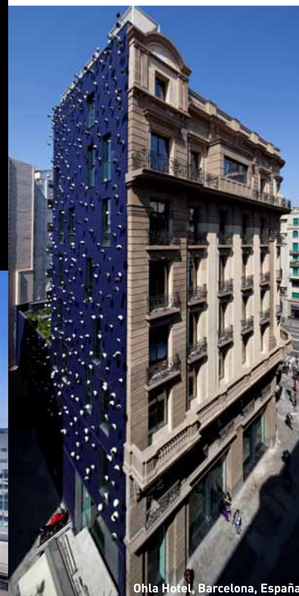
Ohla Hotel, Barcelona, España

Al día de hoy, Alonso Balaguer y Arquitectos Asociados tiene más de 600 proyectos ejecutados, a lo largo de 13 países. Y en la actualidad, son muchísimos proyectos que están en carpeta o ya están tomando forma. En construcción está el mayor rascacielos de Colombia, la torre Bacatá, que será el segundo más alto de Latinoamérica. Acaban de finalizar un nuevo concepto de Balneario Urbano, el "Aire de New York, Ancient Baths", con gran éxito de público y crítica, que ha de ser la punta de lanza de desarrollo de tan novedoso concepto en todo el continente americano. Están a punto de iniciar la construcción de la primera Academia de Tenis de Rafael Nadal, en Manacor, Mallorca, y de un rascacielos en Tegucigalpa. Están construyendo un nuevo barrio de usos mixtos en Constantine, Argelia, y diversos hoteles por muy variados países. La actividad es intensa en esta oficina de socios europeos con vocación global, pero con voluntad local, ya que "En todos los países nos asociamos y trabajamos siempre en conjunto con arquitectos locales, que nos permitan la mejor de las sinergias: el profundo conocimiento de la cultura local, y la visión global. En Chile hemos colaborado así con Archiplan en el Gimnasio Balthus; con A4 en varios edificios de oficinas; con Gonzalo Mardones, con San Martín y Pascal, con Pedro Larraín, con Escipión Munizaga....." comenta Alonso. →