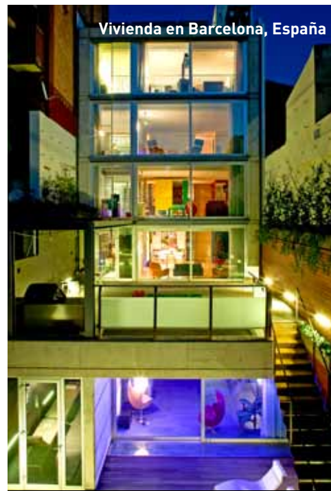
Vivienda en Barcelona, España

En uno de los libros de Luis Alonso, "40 Ideas para 100 Proyectos", sobresale una obra por su envergadura y complejidad técnica. Las Arenas de Barcelona, antigua Plaza de Toros, cambió de rubro y se transformó en un edificio emblemático que ha sido re destinado a nuevos usos. A propósito de este proyecto, Alonso comenta que "Nació como encargo de un nuevo Centro Comercial, sin tener obligación de mantener el edificio, por no ser de una Arquitectura notable. Sin embargo, desde el primer momento luchamos por introducir muchos más usos y funciones, para generar la máxima "promiscuidad funcional", como garantía de que el edificio estuviera activo, vivo, el máximo número de horas al día y el