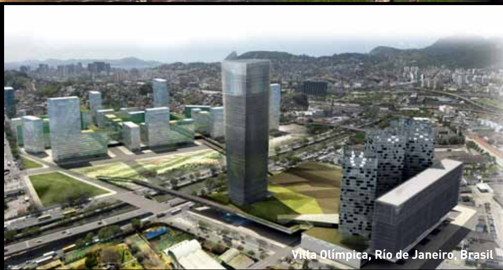
Villa Olímpica, Río de Janeiro, Brasil

Es muy difícil encontrar en el mundo barrios de excelencia, como Vitacura o Las Condes, donde se refleja perfectamente lo que digo. Es un placer visual y urbanístico. Providencia es un lujo de complejidad funcional... 📍